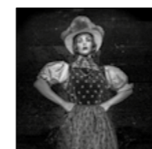
Titelbild: ARTWOOD © Jochen Scherzinger ab Seite 178